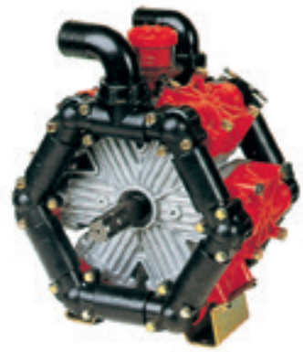
6-Zylinder Kolben-Membran-Pumpe. Fördermenge 260 l/min bei max. 20 bar.

Von Profis. Für Profis. Ob Pumpen, Schläuche, Düsen oder andere Komponenten und Systeme, ob von Jessernigg entwickelt und gefertigt oder von außerhalb zugeliefert – bei JessTrac Anhäng-Feldspritzen vom Typ AgroGigant kommen ausschließlich Lösungen zum Einsatz, die die strengen internen Qualitäts- und Leistungsstandards hundertprozentig erfüllen. Technik ohne Kompromisse.